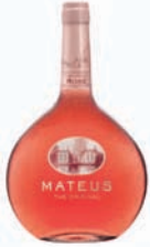
MATEUS ROSÉ ORIGINAL